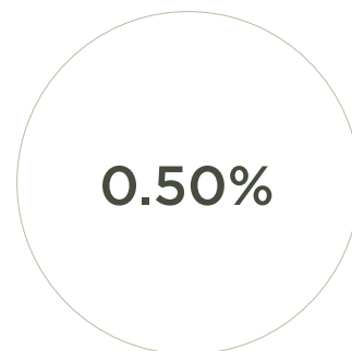
Rame sublimato e nebulizzato